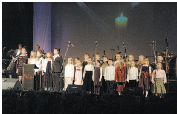
Wie die Alten sangen... Die Melodia-Kids