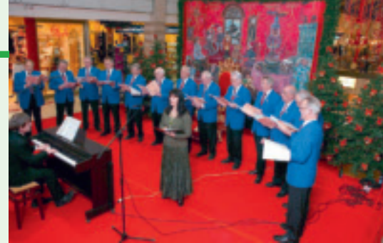
Der Neu-Isenburger Gesangverein Frohsinn Sängerbund wird die Center-Besucher gleich mehrfach mit stimmungsvollen Liedern unterhalten.

chern des Isenburg-Zentrums etwas präsentieren zu können, das sonst niemals öffentlich gezeigt wird.