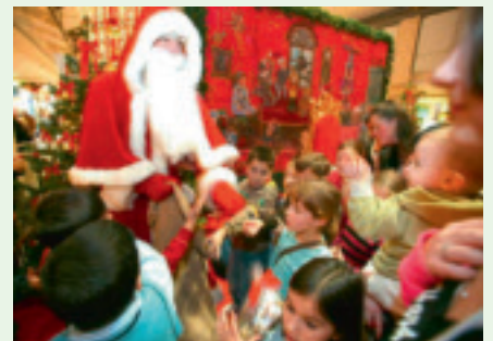
Der Nikolaus wird am Samstag, dem 5. Dezember, ins Isenburg-Zentrum kommen.

Für Knuddeliges und Schönes ist dabei Nici verantwortlich; PapierWelten, Feable House und Depot zeigen tolle neue Objekte und Farbthemen, die frischen Schwung in den Advent und die Feiertage bringen. Für süße Leckereien und die beliebte Weihnachtsbäckerei ist das Café Ernst zuständig und die Buchhandlungen Buch Habel und Weltbild plus zeigen an einem gemeinsamen Stand die ganze Vielfalt rund um das Thema Kalender.