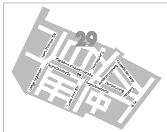
29 Zeppelinheim Bürgerhaus Kapitan-Lehmann-Straße 2