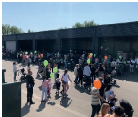
Buntes Treiben beim Müllspiel.