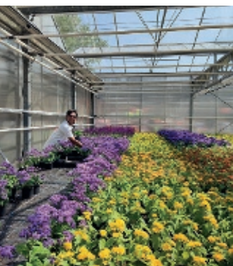
Blumen im DLB-Gewächshaus.

Zum Ende der Veranstaltung waren alle mit dem Erfolg des Tages zufrieden: Eine rundum gelungene Veranstaltung. Das rege Interesse der Neu-Isenburger und Dreieicher Bürger zeigt, dass sich der Aufwand gelohnt hat.